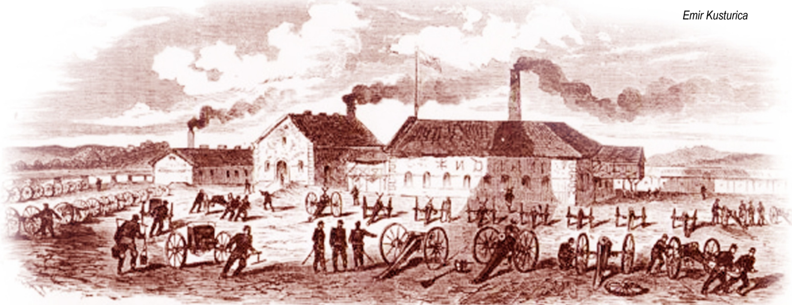
Kragujevačka topolivnica, gravura iz 1876. godine